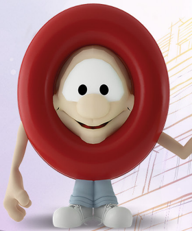
ZÉ DA HORA